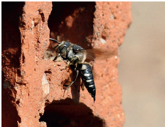
Kegelbiene (Art nicht näher bestimmbar)

Auch diese Gruppe der Wildbienen lebt für sich alleine. Im Gegensatz zu den anderen Wildbienen jedoch legen sie keine eigenen Brutzellen an, sondern schieben Solitärbienen ihre Eier heimlich unter. Eine Brutpflege gibt es bei ihnen nicht, dementsprechend sammeln sie auch keinen Pollen. Sie werden auch als „Kuckucksbienen“ bezeichnet.